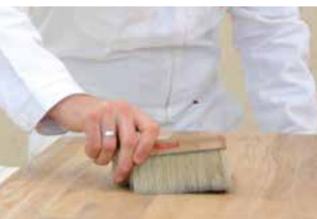
ZBAVIT PRACHU A NEČISTOT