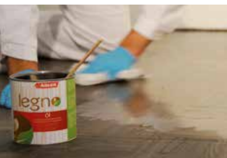
OPAKOVÁNÍ POSTUPU POMOCÍ LEGNO-ÖL NEBO LEGNOCOLOR